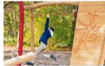
Spezielles Geschick kann von kleineren und größere Kindern auf der „Faunhöhle“ trainiert werden.