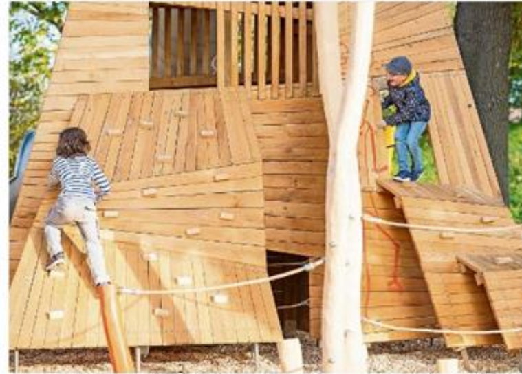
Der neugestaltete Spielplatz Faunhöhe ist eröffnet. Die ersten Nutzer probieren auch das Kletterturm aus. von wittmann